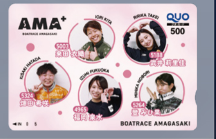
800pt 兵庫支部若手女子選手限定オリジナルクオカード500円分