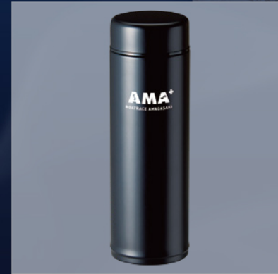
1000pt AMA+オリジナル真空ステンレススリムボトル260ml