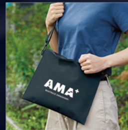
600pt AMA+オリジナル2WAYサコッシュ