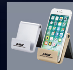
200pt AMA+オリジナルモバイルスタンド&クリーナー