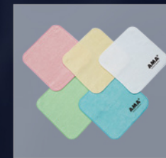
300pt AMA+オリジナルソフトタッチミニタオル