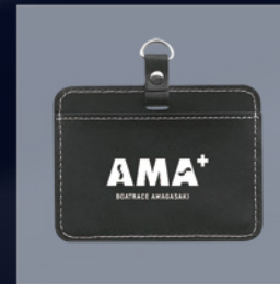
500pt AMA+オリジナルPUバスケース