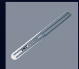
200pt AMA+オリジナルエコ箸 ハーフケース

ポイント交換券に応じた景品をプレゼントいたします。景品は1階インフォメーションでの交換になります。