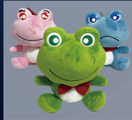
1000pt センブルくんぬいぐるみ(中)