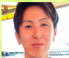
4704 河野 大